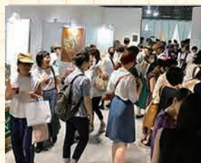
▲開場と同時に多くのお客様