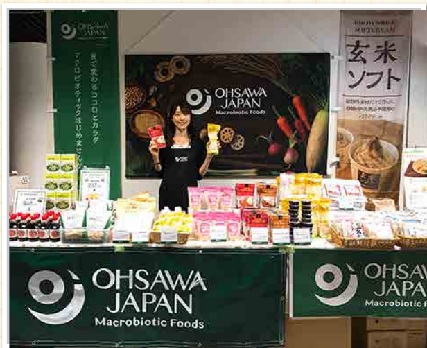
▲オーサワジャパンブース

7/20(土)新宿のアイランドタワーB1Fで開催された『PLANT-BASED EXPO』に出展致しました。ビーガングルメ祭り事務局様が主催する、国内初開催となる植物性商材のみを集めた展示会で、食品メーカーやケータリングサービスなどの業者の方をはじめ、海外のエンドユーザーのお客様も多く来場されていました。会場内には「Slow Vegan Coffe」が某有名コーヒーチェーン店のようなメニューをALL VEGANで提供した一日限定カフェが長蛇の列をなし大盛況でした。弊社も食材を提供させていただき、多くのお客様がVegan Foodを味わい賑わっていました。