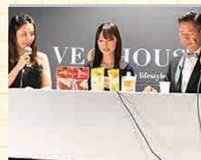
▲VEG HOUSE on TVの収録

オーサワジャパンブースは玄米甘酒や豆乳マヨネーズなど人気商品を販売し、業務用の野菜ブイヨンや大豆ミートなどを紹介しました。また、マクロビオティック情報満載のフリーマガジン「LM(Life is Macrobiotic)」やマクロビオティッククッキングスクールリマの体験レッスンの紹介をさせていただき、お客様から直接、貴重なご意見をいただくことができました。